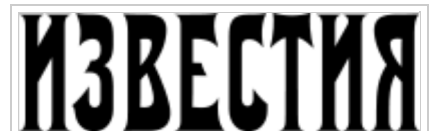
Logo der Iswestija , für die Ehrenburg fünf Jahre lang als Auslandskorrespondent arbeitete.