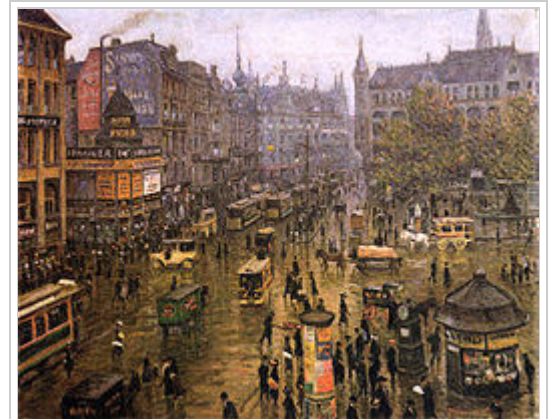
„Spittelmarkt“ (Gemälde von Paul Hoeniger, Berlin 1912). In Berlin, „der Stadt der hässlichen Denkmäler und der ruhelosen Augen“, verbrachte Ehrenburg zwei sehr produktive Jahre.