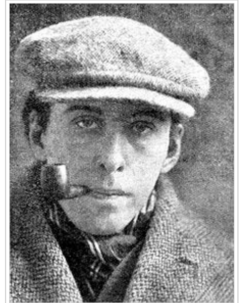
Ilja Ehrenburg im Jahr 1925

In Paris verarbeitete er die sozialen Verwerfungen der NÖP in den Romanen Der Raffer (deutsch auch: Michail Lykow ) und In der Prototschni-Gasse (deutsch: Die Gasse am Moskaufloss bzw. Die Abflussgasse ). Es gestaltete sich sehr schwierig, diese Bücher in der Sowjetunion zu publizieren. Bereits seine ersten Romane hatten dort neben positiven auch eine Reihe sehr negativer Rezensionen erhalten, vor allem in der Zeitschrift der „proletarischen“ Schriftsteller Auf dem Posten („Na Postu“), die ihn als heimatlosen, antirevolutionären Intellektuellen abstempelte. Diese Probleme erreichten ihren Höhepunkt mit dem Roman Das bewegte Leben