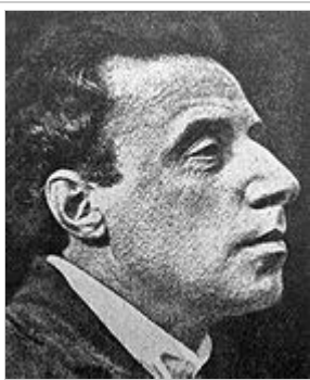
1920/21 arbeitete Ehrenburg für Wsewolod Meyerhold in der „Sektion für Kinder- und Jugendtheater“.