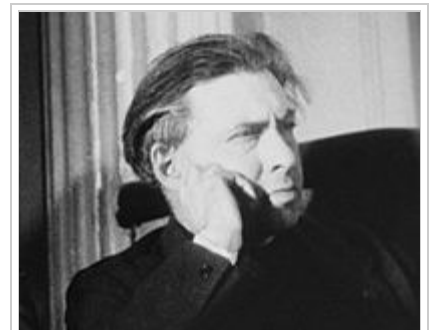
Ehrenburg als Zuschauer bei einem Kriegsverbrecherprozess in Charkow, Dezember 1943

Gemeinsam mit Wassili Grossman begann Ehrenburg Berichte über die deutschen Massaker an Juden zu sammeln, die in die weltweit erste umfassende Dokumentation der Shoa münden sollten: das Schwarzbuch über den Genozid an den sowjetischen Juden , das mit Unterstützung amerikanischer jüdischer Organisationen (u. a. unter wesentlicher Beteiligung von Albert Einstein) konzipiert wurde und für ein gleichzeitiges Erscheinen in den USA und der Sowjetunion vorgesehen war. Ehrenburg und Grossman fungierten als Herausgeber und trugen selbst Berichte bei. [24] Zu den Mitarbeitern gehörten Margarita Aliger, Abraham Sutzkever, Solomon Michoels und Owadi Sawitsch. Besonders wichtig war Ehrenburg eine Veröffentlichung in der Sowjetunion, weil er über den „heimischen“ Antisemitismus sehr gut Bescheid wusste. [25] Teile des Materials konnten in Snamja und der jiddischsprachigen Sammlung Merder fun Felker erscheinen, doch es gab zunehmend Probleme mit der sowjetischen Zensur, die Berichte über jüdische Opfer und Kämpfer als nationalistische Verirrung ansah. Schließlich wurde der bereits fertige Satz 1948 im Zuge von Stalins antisemitischen Kampagnen zerstört. Das Schwarzbuch ist in der Sowjetunion nie erschienen.