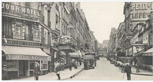
Montmartre (um 1925). Paris wurde zu Ehrenburgs zweiter Heimat und ist Schauplatz einer Reihe von Erzählungen, etwa von Sommer 1925 .

des Lasik Roitschwantz, dessen Veröffentlichung die sowjetischen Medien rundweg ablehnten.