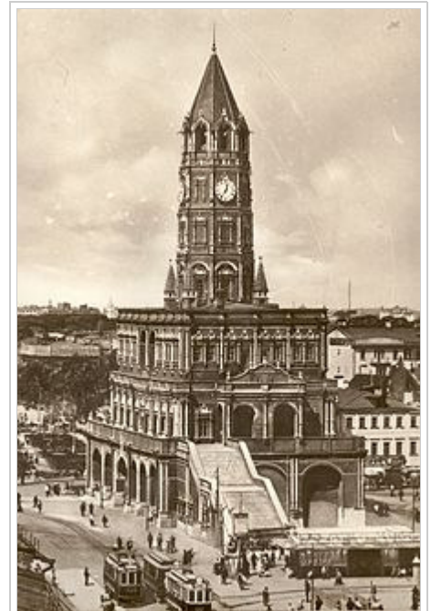
Der Sucharew-Turm in Moskau 1927. In Ehrenburgs Roman In der Prototschni-Gasse spielt der Sucharewka-Markt rund um den Turm mehrfach eine Rolle.

Ende der 1920er Jahre wandte sich Ehrenburg neuen Prosaformen zu, die durch die Integration von empirischen Daten und Fakten gekennzeichnet waren: Statistiken, historische Dokumente, Beobachtungen usw. Diese