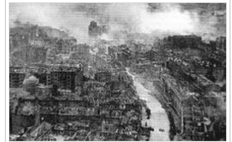
Das zerstörte Kiew im Zweiten Weltkrieg (1941).