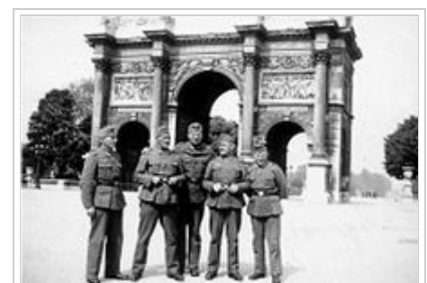
Der „Fall von Paris“ – Deutsche Soldaten 1940 vor dem Arc de Triomphe du Carrousel

Ab Mai 1939 wurden seine Artikel für Iswestija plötzlich nicht mehr gedruckt, obwohl sein Gehalt weiterbezahlt wurde. Der Grund dürfte darin liegen, dass die Sowjetunion einen Politikwechsel erwog – von der antifaschistischen Volksfrontpolitik hin zum Bündnis mit Deutschland. [21] Als im August der Hitler-Stalin-Pakt gemeldet wurde, erlitt Ehrenburg einen Zusammenbruch. Er konnte nichts mehr essen, monatelang nur mehr flüssige Nahrung zu sich nehmen und magerte stark ab; Freunde und Bekannte befürchteten, dass er sich umbringen werde. [22] Beim deutschen Einmarsch 1940 waren die Ehrenburgs immer noch in Paris – Frankreich hatte sie aufgrund von Steuerstreitigkeiten nicht ausreisen lassen. Sechs Wochen wohnten sie in einem Zimmer der sowjetischen Botschaft, dann konnten sie nach Moskau abreisen.