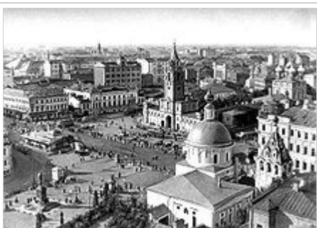
(Strastnaja-Platz, Moskau 1920, heute: Puschkin-Platz). In Moskau erlebte Ehrenburg die Tage der Oktoberrevolution und ein ganzes Jahr Kriegskommunismus.

Zu Beginn des Ersten Weltkriegs meldete sich Ehrenburg freiwillig zum Kampf für Frankreich, wurde aber als untauglich abgewiesen. Da keine Geldanweisungen aus Russland mehr möglich waren, verschlechterte sich seine ökonomische Lage, er hielt sich mit Verladearbeiten am Bahnhof und Schreiben über Wasser. 1915 begann er als Kriegskorrespondent für russische Zeitungen, insbesondere für die Petersburger Börsenzeitung zu schreiben. Seine Reportagen von der Front, u. a. aus Verdun, beschrieben den mechanisierten Krieg in seiner ganzen Entsetzlichkeit. Er berichtete auch über Kolonialsoldaten aus dem Senegal, die zum Kriegsdienst gezwungen wurden, und handelte sich damit Probleme mit der französischen Zensur ein. [4]