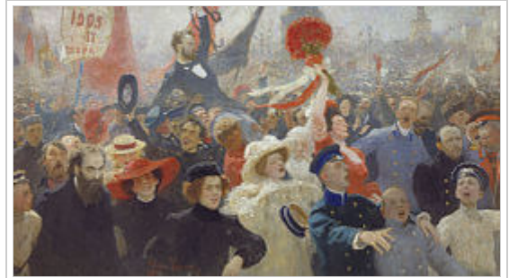
„Demonstration am 17. Oktober 1905“

folgenden Jahr schlossen sie sich einer bolschewistischen Untergrundgruppe an. Ehrenburg verteilte illegal Parteizeitungen und hielt Reden in Fabriken und Kasernen. 1907 wurde er von der Schule verwiesen, 1908 verhaftete ihn die zaristische Geheimpolizei, die Ochrana. Er verbrachte fünf Monate im Gefängnis, wo er geschlagen wurde (einige seiner Zähne brachen dabei ab). Nach seiner Freilassung musste er sich in wechselnden Provinzorten aufhalten und versuchte dort erneut bolschewistische Kontakte zu knüpfen. Schließlich gelang es seinem Vater 1908, wegen Ilja Ehrenburgs angeschlagener Gesundheit einen „Kuraufenthalt“ im Ausland zu erwirken; er hinterlegte dafür eine Kautions, die später verfiel. Ehrenburg wählte Paris als Exilort, nach eigenen Angaben, weil Lenin sich damals dort aufhielt. Seine Schulbildung hat er nie abgeschlossen.