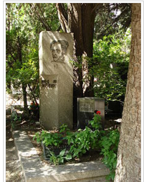
Ehrenburgs Grab auf dem Nowodewitschi-Friedhof mit Picassos Porträt