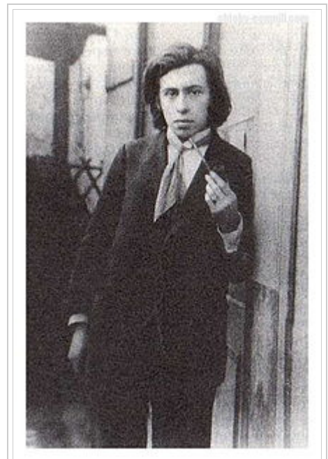
Der junge Ehrenburg

In Paris suchte Ehrenburg Lenin auf und beteiligte sich zunächst an der politischen Arbeit der Bolschewiki. Doch er nahm bald Anstoß an den zahlreichen Streitigkeiten der Fraktionen und Grüppchen, vor allem aber dem mangelnden Interesse der exilrussischen Gemeinde für das Pariser Leben. Seine Geliebte und Parteigenossin, die Dichterin Jelisaweta Polonskaja, vermittelte ihm einen Kontakt zu Leo Trotzki, der sich zu dieser Zeit in Wien aufhielt. Doch Ehrenburg war von Trotzki tief enttäuscht. In seinen Memoiren berichtet er, dass dieser die Werke von Ehrenburgs damaligen literarischen Vorbildern, den russischen Symbolisten Waleri Brjussow, Alexander Blok, Konstantin Balmont als dekadent aburteilte und ihm gegenüber die Kunst generell als sekundär und der Politik untergeordnet bezeichnete. (Allerdings verzichtet Ehrenburg darauf, Trotzki beim Namen zu nennen, dieser taucht lediglich als „der bekannte Sozialdemokrat Ch.“ auf.) [2] Er war tief enttäuscht und kehrte nach Paris zurück. Dort produzierte er gemeinsam mit Polonskaja eine Zeitschrift unter dem Titel Leute von gestern , die satirische Karikaturen Lenins und anderer führender Sozialisten enthielt, und machte sich auf diese Weise gründlich unbeliebt. Bald darauf verließ er die bolschewistische Organisation und blieb seitdem bis an sein Lebensende parteilos.