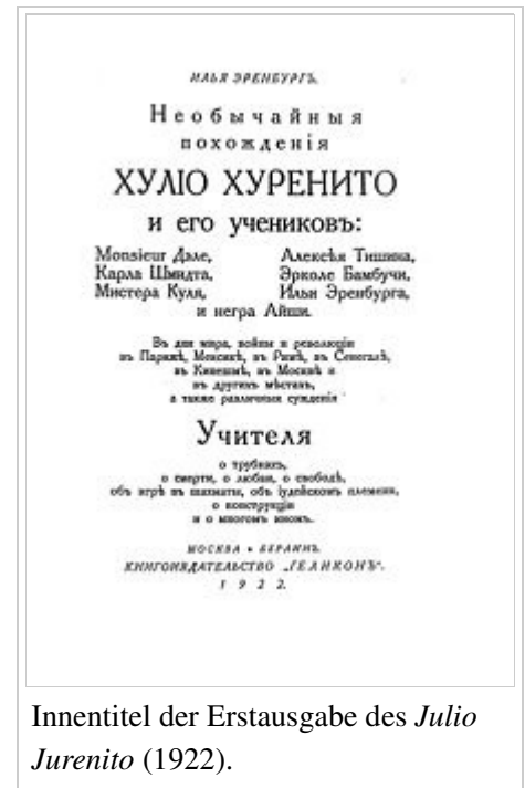
Innentitel der Erstausgabe des Julio Jurenito (1922).